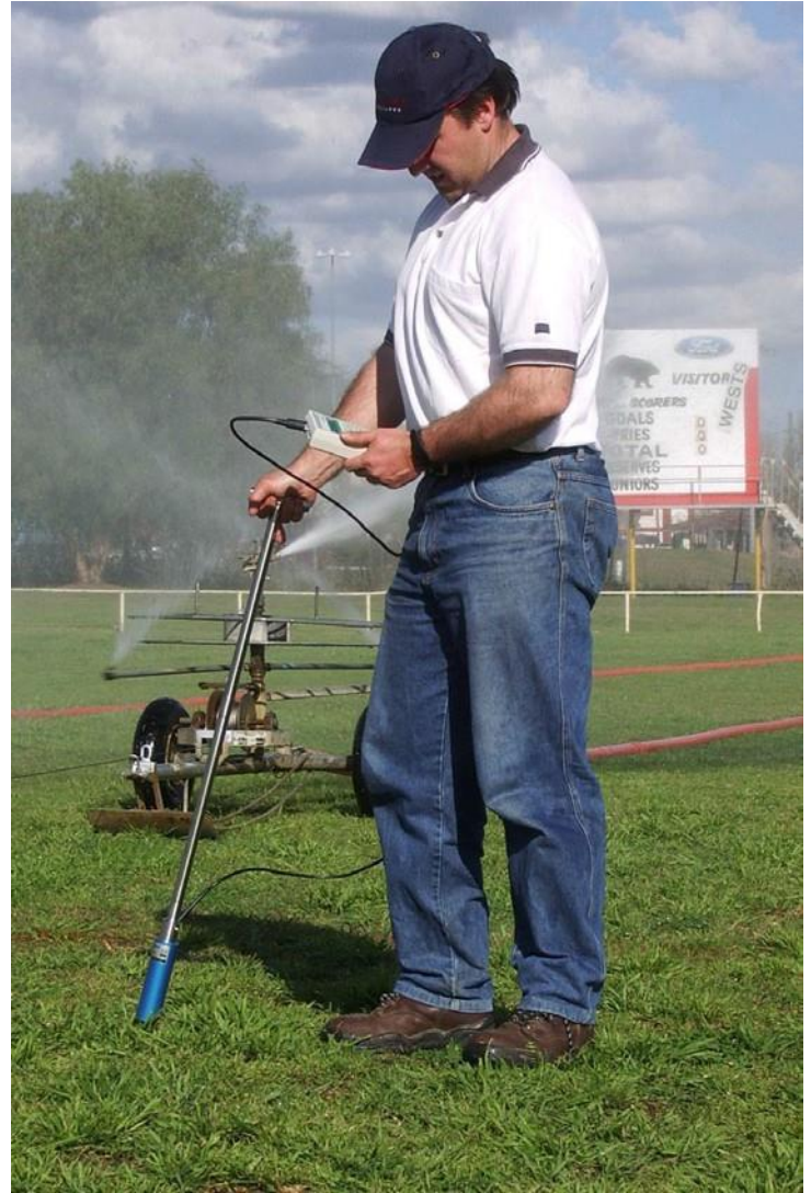
利用 MPKit 监测表层土壤含水量

MPExt Rod 由一对铬合金延长棒组成。每根延长棒均为 35cm 长，可使仪器测量到位于地表下方 70cm 深处或土壤剖面内 70cm 深处测点的土壤含水量。其中一根延长棒连接到 MP406 传感器，另一根则具有一个“T”字形手柄。如果您有需要，我们将会为您提供一根额外的 35cm 延长棒。